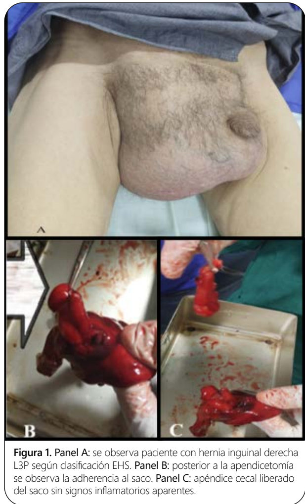
Figura 1. Panel A: se observa paciente con hernia inguinal derecha L3P según clasificación EHS. Panel B: posterior a la apendicetomía se observa la adherencia al saco. Panel C: apéndice cecal liberado del saco sin signos inflamatorios aparentes.

Se obtuvo el consentimiento informado del paciente referido en el artículo, este documento obra en poder del autor de correspondencia.