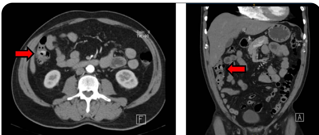
Figura 2. Angiotomografía de abdomen, fase arterial. Obsérvese el realce parietal focal en la pared medial, por debajo del ángulo hepático de colon. (Izquierda: corte axial / Derecha: corte coronal)

nes sanguinolentas en gran cantidad (hematoquecia) por lo cual se decide realizar endoscopia digestiva alta de urgencia, que no arroja datos de valor. El paciente queda con diagnóstico de hemorragia digestiva oculta en planes de realizar angiotomografía y enteroscopia.