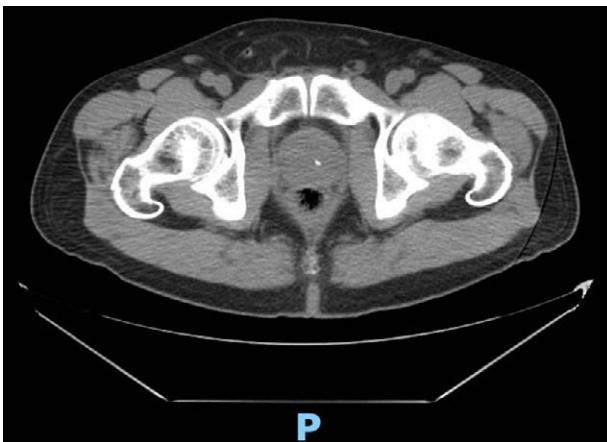
Figura 3. Tomografía de abdomen en corte axial con evidencia de apéndice vermiforme en región inguinal derecha.