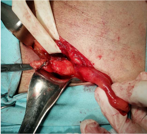
Figura 1. Imagen clínica de apéndice vermiforme.