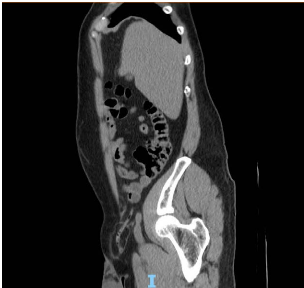
Figura 2. Tomografía de abdomen en corte sagital con evidencia de apéndice vermiforme en región inguinal derecha.